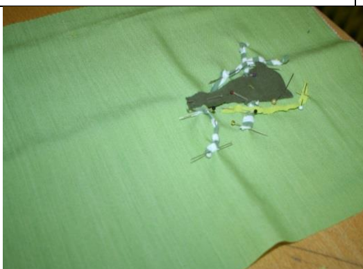
Oblikovanje krpanke po skici.