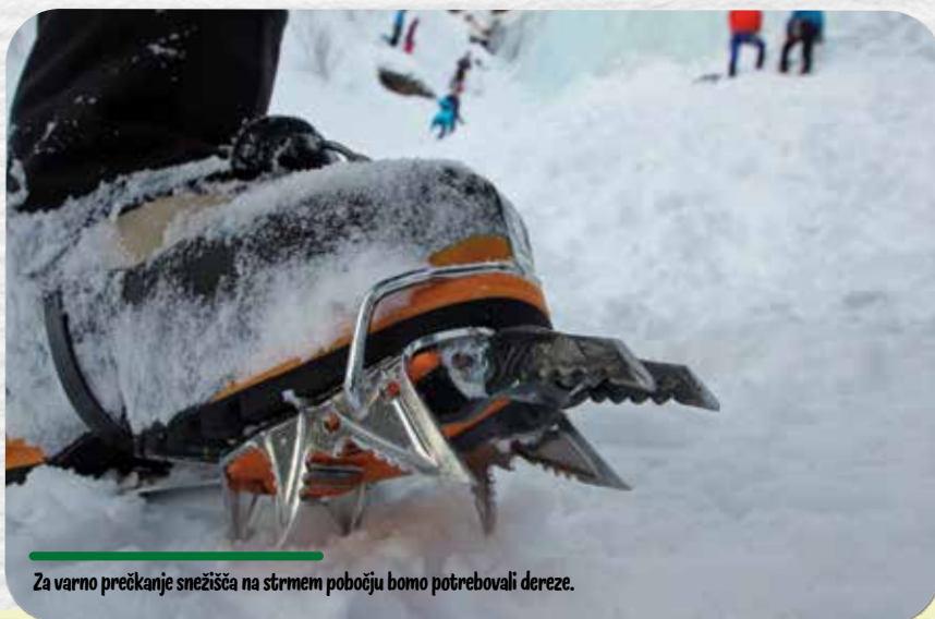
Za varno prečkanje snežišča na strmih pobočju bomo potrebovali dereze.

če bi potrebovali njihovo pomoč. Če se zgodi nesreča, pokličemo center za obveščanje na številko 112. Na planinskih poteh, ki so izpostavljene padajočemu kamenju, uporabimo čelado. Na zahtevnih in zelo zahtevnih poteh, opremljenih z varovali, uporabimo opremo za samovarovanje. Še prej se moramo seveda naučiti njene pravilne uporabe. To velja tudi za uporabo zimske opreme. Tečaje varnega gibanja v gorah v letnih in zimskih razmerah redno organizirajo različna planinska in športna društva.