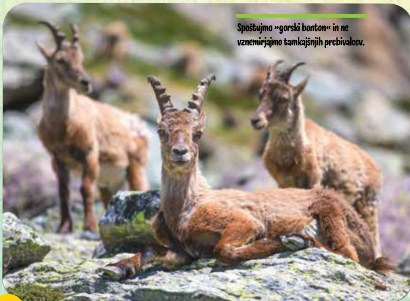
Spoštujemo »gorski bonton« in ne vznemirjamo tamkajšnjih prebivalcev.