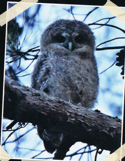
▲ Mladič lesne sove

Ko so lesne sove stare eno leto, si poiščejo partnerja, s katerim ostanejo vse življenje. Izberejo si svoje ozemlje, ki se z leti zelo malo spreminja. Starša skrbita za mladičke dva do tri mesece. Po tem času si mlade lesne sove poiščejo svoje ozemlje. Starša mladiče neustrašno branita. Tega se dobro zavedajo obročkarji ptičev, ki se morajo pri obročkanju mladih sov zaščititi s čeladami z vizirji.