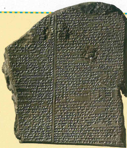
Enajsta tablica. Epa o Gilgamešu z mitom o vesoljnem potopu

Kako so se mitologije v preteklosti prepletale, se kaže tudi v podobnostih različnih zgodb, ki govorijo o vesoljnem potopu: gradnja barke, na kateri se bodo izbranci in živali rešili pred poplavo, božja jeza ipd. Babilonski Ep o Gilgamešu (najstarejši junaški ep) pripoveduje o potopu, ki ga je poslal bog, da bi uničil človeštvo. Glavni junak te zgodbe je Utnapištim, ki zgradi ladjo in se reši pred potopom. Iz hinduizma poznamo zgodbo o Manuju , prvem človeku, in poplavi, le da Manuja reši riba, ki ga pripelje na vrh gore. Pri Aboriginih (prvotnih avstralskih prebivalcih) je zgodb o poplavah več, pogosto pa gre za nasprotje med naravo oz. mitološkimi živalmi in človekom. Pri Majih obstaja zgodba o potopu v njihovi sveti knjigi Popol Vuh : ta vsebuje zgodbo o stvarjenju in uničenju zgodnje oblike človeštva, ki se zgodi, ker je bila stvaritev take oblike človeštva napaka. Poplava je tu uporabljena kot izbris napake in ne za kaznovanje človeških grehov.