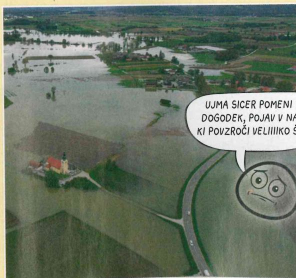
Reka Krka redno poplavlja šentjernejsko polje.

Povodnji povzročijo veliko več škode in tudi katastrofalne posledice, ki jim težko uideemo, saj prizadenejo tako naravo kot ljudi. Gre za veliko poplavno vodo, ki prekrije celotno poplavno področje ali večji del naplavne ravnice. Ob ogromni materialni škodi pogosto jemlje tudi življenja ljudi in drugih živih bitij.