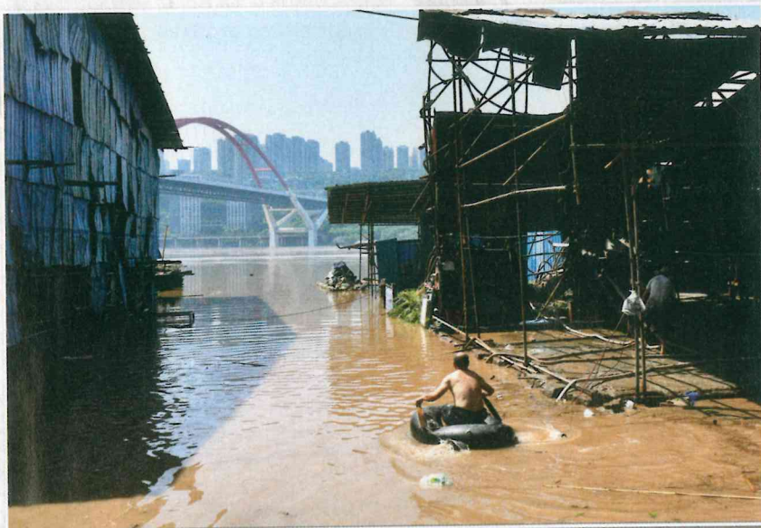
Reka Jangce je poplavlila tržnico, 2020.