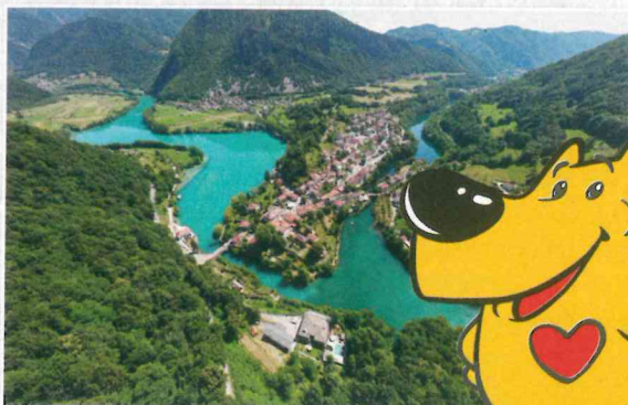
Most na Soči

Zadrževanje voda posnema naravno dogajanje. V preteklosti so na rekah, predvsem za mline in žage, tok upočas-