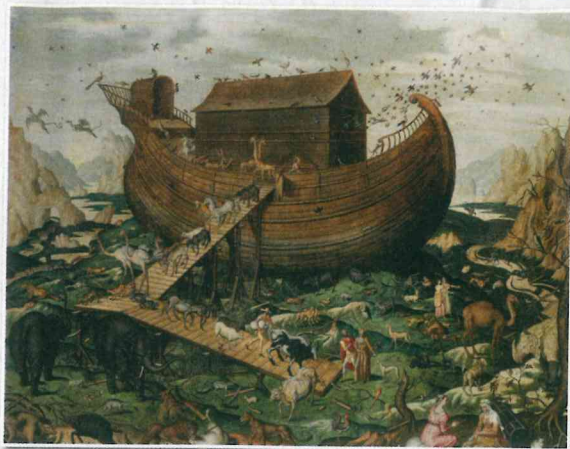
Noetova barka na gori Ararat, olje na platnu, Simon de Myle, 1870