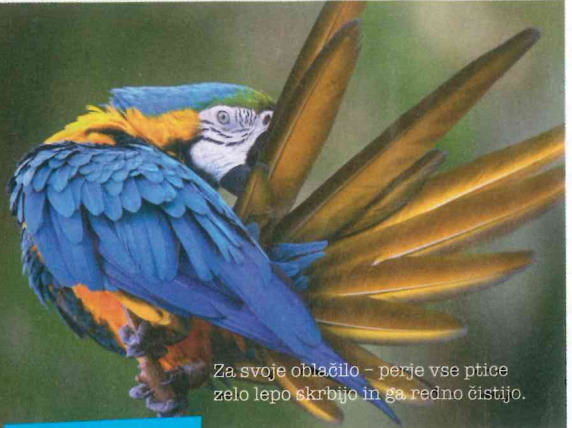
Za svoje oblačilo – perje vse ptice zelo lepo skrbijo in ga redno čistijo.

Ptice si perje redno čistijo. Večina si na perje nanaša olje iz žleze blizu repa . Olje zagotavlja, da voda s perja odteče in ne razmoči perja. Ptice vsaj enkrat na leto odvržejo staro perje, ki ga nadomesti novo.