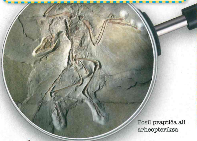
Fosil praptiča ali arheopteriksa.

Zemlja je stara kar 4,5 milijarde let. Če bi skušali njen razvoj opisati s 24-urnim dnevom, so se prve preproste oblike življenja pojavile približno ob štirih zjutraj. Ob treh popoldne se pojavijo nitastim algam podobni evkarionti. Ob pol šestih zvečer se pojavita spol in spolno razmnoževanje. Večcelični predstavniki se potem začnejo pojavljati tudi na kopnem, ob desetih zvečer obstajajo moderni kopenski ekosistemi. Dinozavri se pojavijo ob 22.45, ob 23.41 pa v Zemljo trešči orjaški meteorit, ki povzroči podnebne spremembe in s tem njihovo izumrtje. Šele minuto pred polnočjo se pojavi rod Homo, Homo sapiens (moderni človek) pa šele v zadnjih 6 sekundah.