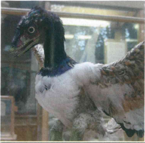
Model praprtiča, izdelan po fosilnih ostankih, v prirodoslovnem muzeju v Oxfordu