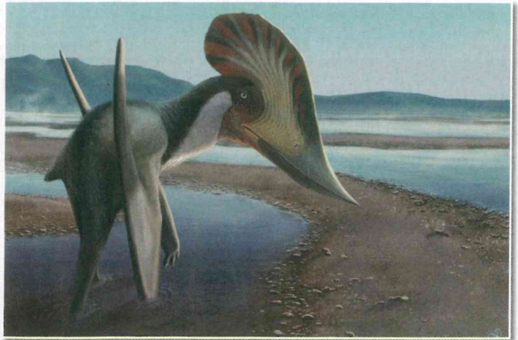
Pterozavri so izumrli plazilci. Bili so prvi znani vretenčarji, ki so leteli. Njihova krila so sestavljale mišice in kožna opna, ki je bila napeta med gležnjem in izjemno podaljšanim četrtem prstom.