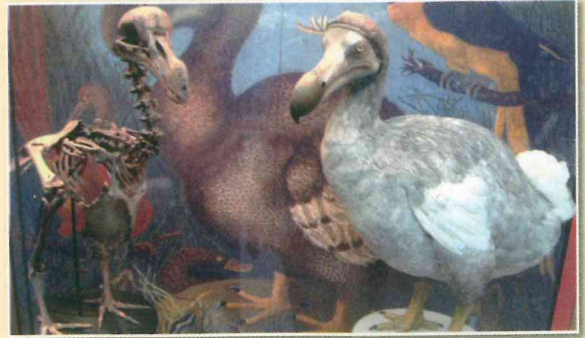
Model doda v prirodoslovnem muzeju v Oxfordu, izdelan po najdenih okostjih.

Dodo je bil velik golob, katerega predniki so prileteli na Mavricij, otok ob obali Afrike v jugozahodnem Indijskem oceanu, pred milijon leti. V novem okolju niso imeli naravnih plenilcev in so zaradi tega lahko mirno uživali življenje na gozdnih tleh. Počasi so izgubili sposobnost letenja, zato se jim je razvilo večje telo. Tisoče let je dodo užival v tem raji do usodnega dne, ko so v 17. stoletju na Mavriciju pristali Holandci (provinca Holandija je bila pomorska in gospodarska sila, del neodvisne Republike Nizozemske). Natančnega datuma izumrtja doda ne vemo, lahko pa zelo dobro določimo, zakaj se je to zgodilo. Danes mislijo, da to ni bil čisto neposreden vpliv prišlekov, čeprav so Holandci gotovo polovili kar precej dodov. Vendar še pomembneje, s sabo so pripeljali številne živali: podgane, mačke, pse, prašiče in opice. Ker tudi te živali na otoku niso imele naravnih plenilcev, so se v kratkem času izjemno namnožile. Podiv-